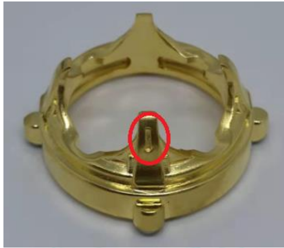
紅色圓圈- 水晶支架標記

水晶球支架的設計概念，是基於能完美將水晶球組裝到曼陀羅療癒棒上。支架有四個角，而其中一個角上有一個凹槽，作為支架標記，供使用者用來對齊曼陀羅療癒棒頂部上的磁鐵，然後組裝以固定支架。